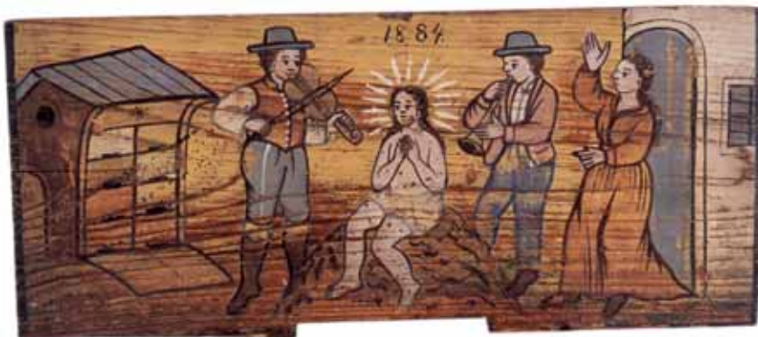
Panjska končnica z Jobom na gnoju. Po ljudski pesmi si je bolni Job za tolažbo zaželel glasbe. Godcem je vrgel pest črvov, ki so se spremenili v zlatnike.

Toda glasba se s takšno umetnostjo ne konča. Izvajajo jo tudi preprosti, nešolani ljudje. A drugačno. To je področje ljudske glasbe , ki jo je še najtežje opredeliti, saj obsega tudi najstarejše glasbene prakse, kar jih lahko srečamo na tem planetu, čeprav ne moremo vedeti, kako so se spreminjale skozi čas. Ta glasba naj bi se prenašala čim manj spremenjena iz roda v rod kot izročilo, zato ji rečemo tudi tradicionalna glasba . Beseda tradicija namreč izhaja iz latinske besede trado , ki pomeni predati oz.