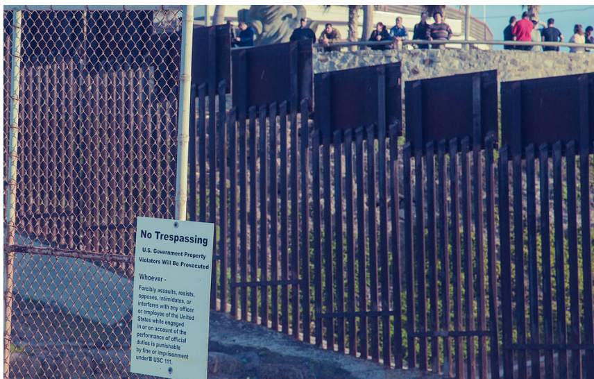
Ograja na ameriško-mehiški meji pri San Diegu

pred »Drugim«, pred zunanjim, pred neznanim ali zaradi predsodkov so »prišleki« v nekaterih družbah sprejeti zadržano, odklonilno, tudi sovražno. Prevladuje mnenje, da bi morali mednarodne migracije omejiti, srečujemo se s škodljivimi in za celotno družbo nevarnimi posledicami naraščajočega nacionalizma in ksenofobije. V »obrambo« države vlade gradijo nove zidove, kot na primer na meji med ZDA in Mehiko, ali postavljajo panelne ograje, ki fizično spreminjajo demokratično Evropsko unijo v trdnjavo. Takšni ukrepi med drugim močno vplivajo na odločitve posameznika in sooblikujejo prihodnje migracijske tokove.